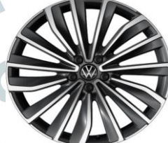
TRONDHEIM 20" PI1