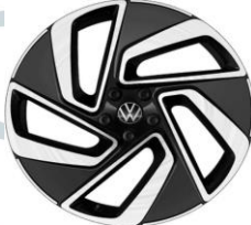
MONTREAL 20" PJ2