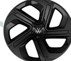
OSLO 20" PJ3