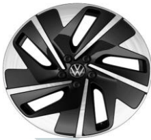
HUDSON 19" PJ4