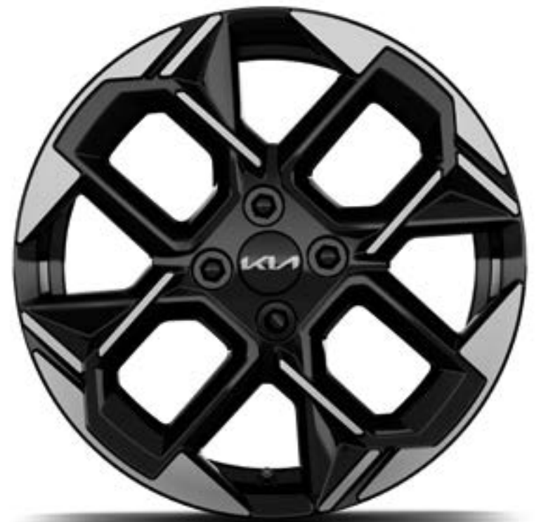
Llanta de aleación de 16" GT-Line