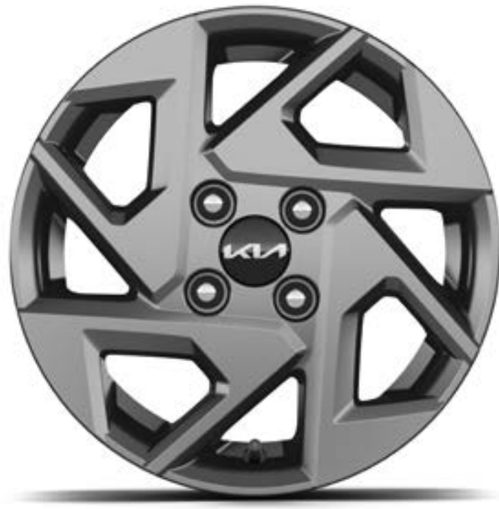
Llanta de aleación de 14"