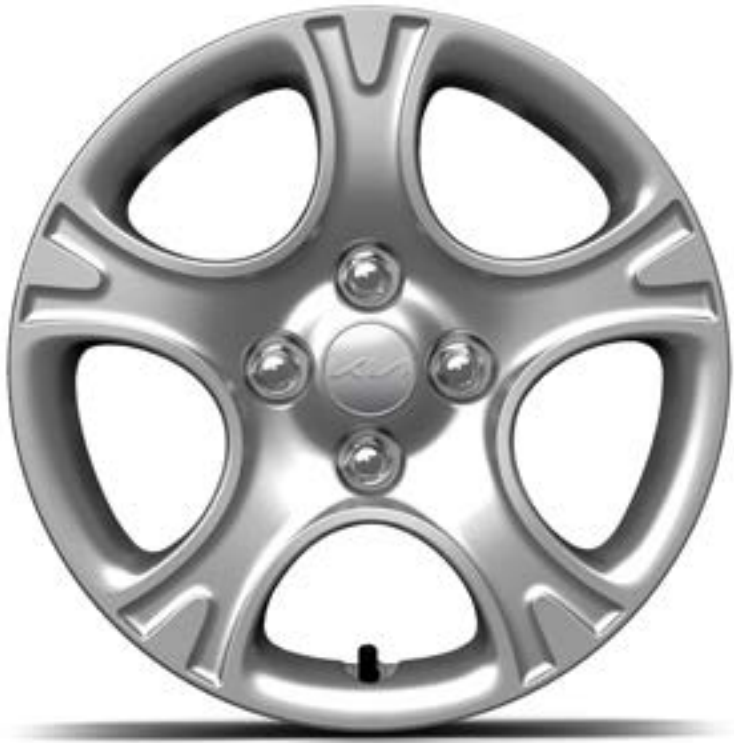
Llanta de acero de 14"