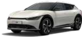
Glacier (GLB) - (no disponible GT-line)