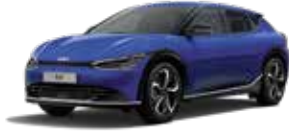
Yacht Blue (DU3)