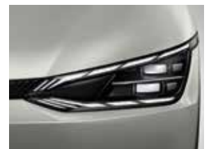
Sistema de Iluminación Frontal adaptativo Inteligente (Front-lighting System IFS). (Equipamiento según versión).

De conformidad con la Normativa (EU) 2020/740 sobre eficiencia de neumáticos y otros parámetros consulta nuestro sitio web [www.kia.com]. La información facilitada sobre neumáticos es meramente informativa.