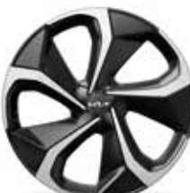
Neumáticos 255/45 con llantas de 51 cm (20") (GT-line)