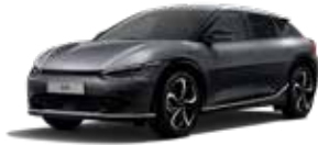
Interstellar Grey (AGT) - (no disponible GT-line)