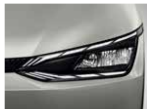
Faros de LED (MFR). (Equipamiento según versión).