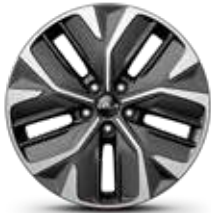
Neumáticos 235/55 con llantas de 48 cm (19") (Air)