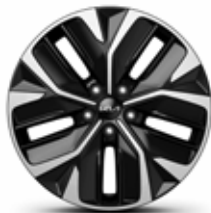
Neumáticos 235/55 con llantas de 48 cm (19") (Air Pack GT Line)