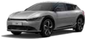
Steel Grey (KLG) - (no disponible GT-line)