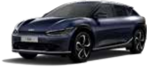
Gravity Blue (B4U) - (no disponible GT-line)