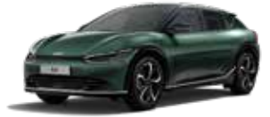
Deep Forest (G4E) - (no disponible GT-line)