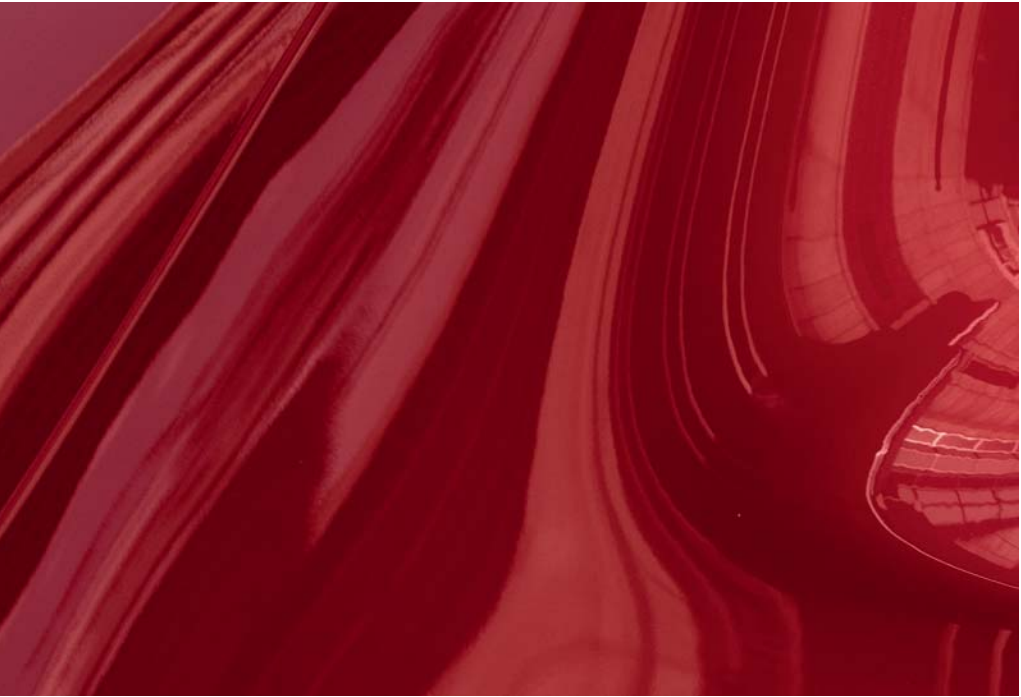
Soul Red Crystal