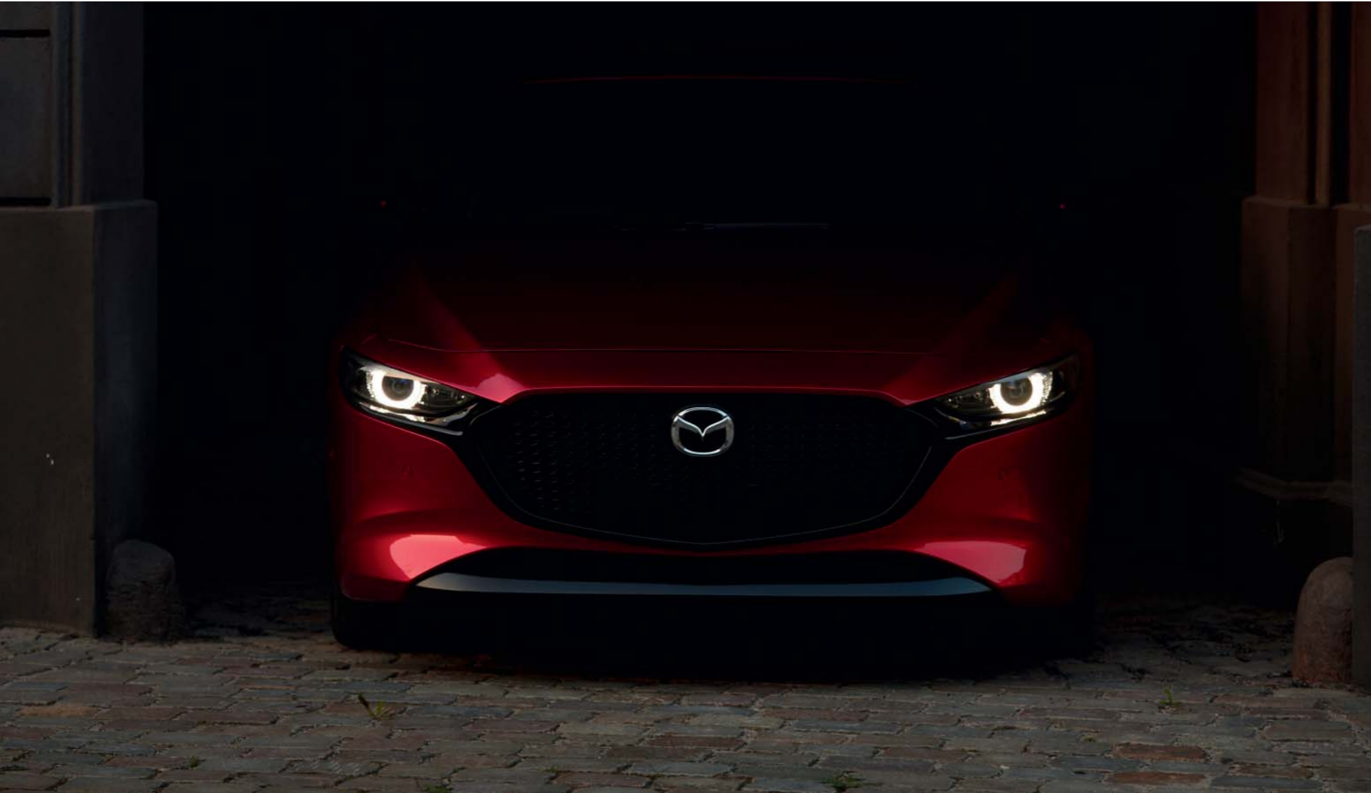
La imagen muestra un Mazda3 Zenith-X Safety Black en Soul Red Crystal