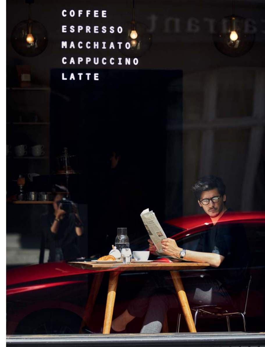
La imagen muestra un Mazda3 Zenith-X Safety Black en Soul Red Crystal