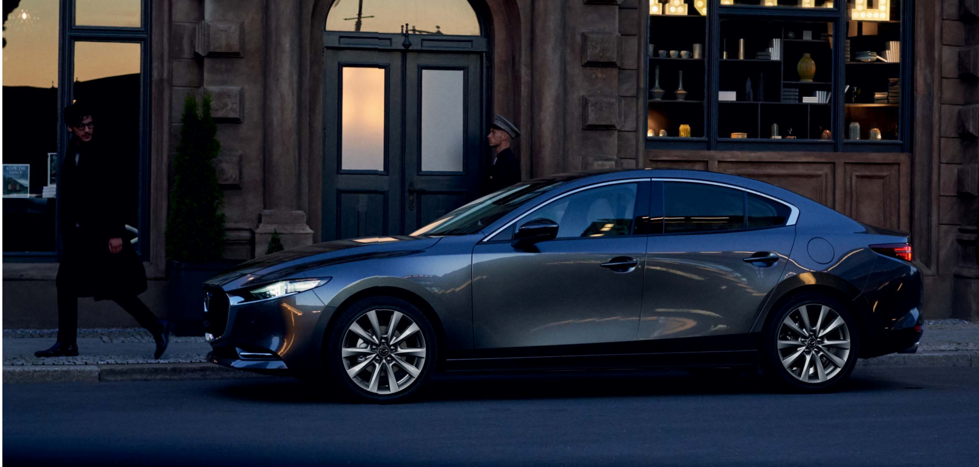
La imagen muestra un Mazda3 Sedán Zenith-X Safety White en Machine Gray