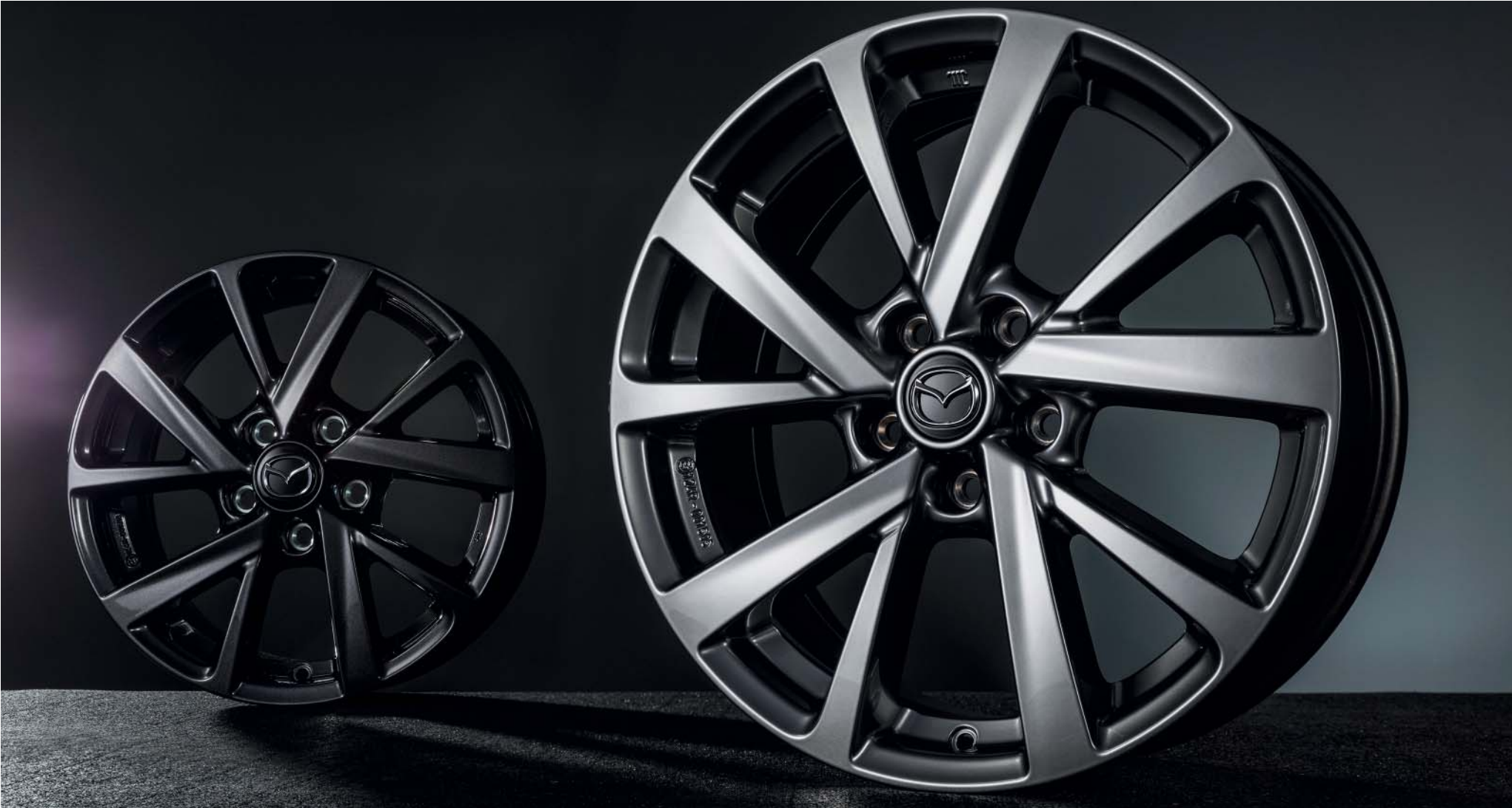
Llantas de aleación de 16" y 18" (varios colores disponibles)