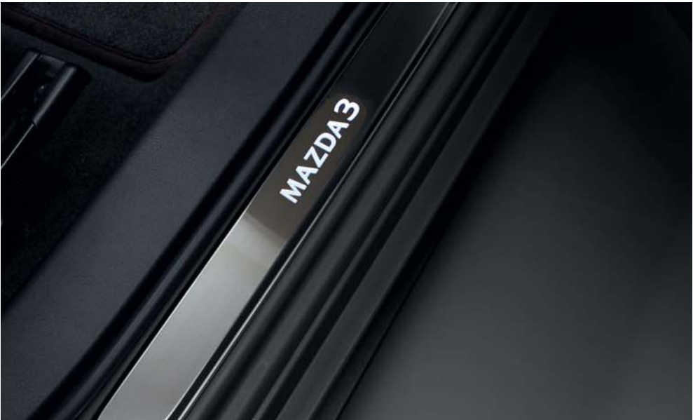
Umbrales de puerta iluminados