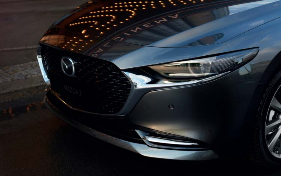
La imagen muestra un Mazda3 Sedán Zenith-X Safety White en Machine Gray