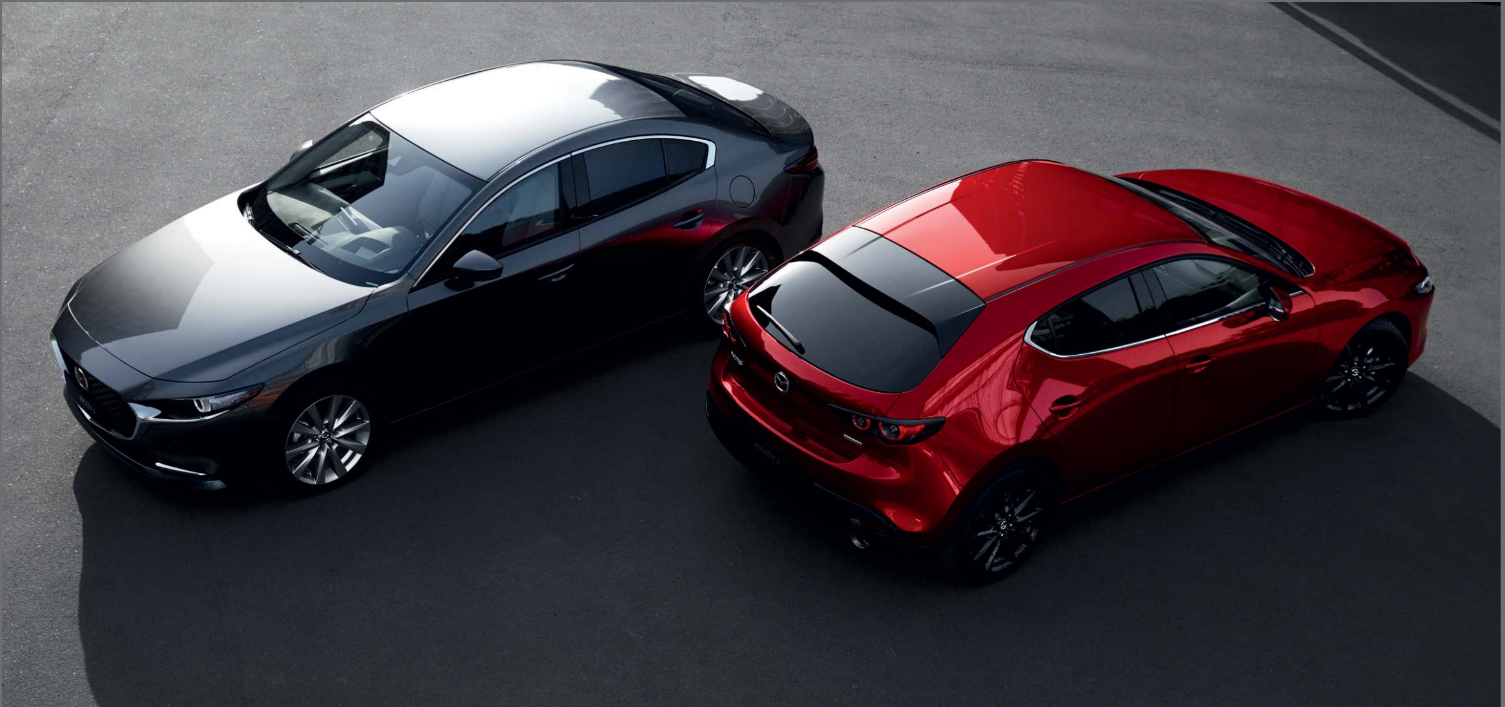
La imagen muestra un Mazda3 Sedán Zenith-X Safety White en Machine Gray y un Mazda3 Zenith-X Safety Black en Soul Red Crystal