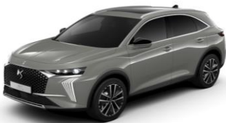
Lacquered Grey (Nuevo)