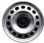
RUEDA DE CHAPA 15' SERIE EN 600 Kg