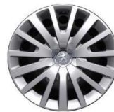
RUEDA 15" CON EMBELLECEDOR MILFORD