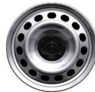
RUEDA DE CHAPA 16' SERIE EN 1000 Kg