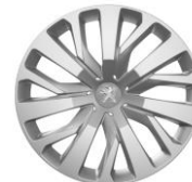
RUEDA 16" CON EMBELLECEDOR RAKIURA