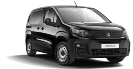
Negro Perla Nera