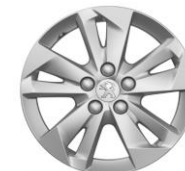
LLANTA DE ALEACIÓN 16" TARANAKI (gris Anthra)